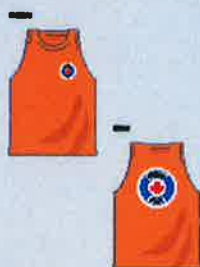
Majica brez rokavov