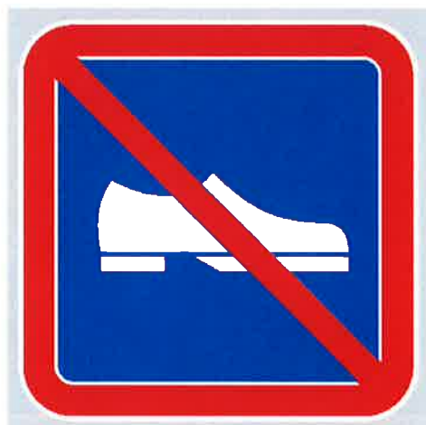
Znak št. 8: "Prepoved hoje v obuvalu" (35. člen)