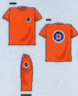
Majica s krovnimi rokavi