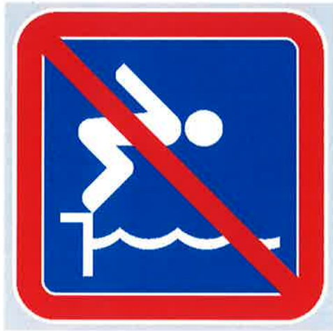
Znak št. 11: "Prepoved skakanja v vodo" (35. člen)