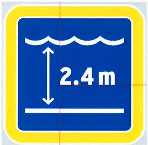
Znak št. 13: "Globina vode" (36. člen)