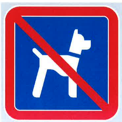
Znak št. 9: "Prepoved vstopa živalim" (35. člen)