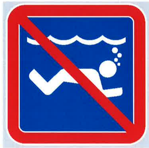
Znak št. 12: "Prepoved plavanja pod vodo" (35. člen)