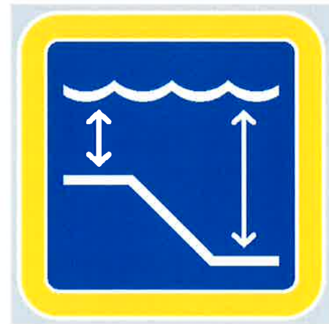
Znak št. 14: "Sprememba globine vode" (36. člen)