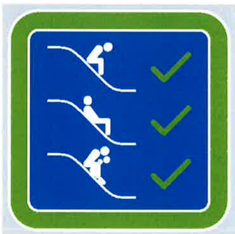
Znak št. 7: "Dovoljeni položaji pri spuščanju po toboganu" (34. člen)