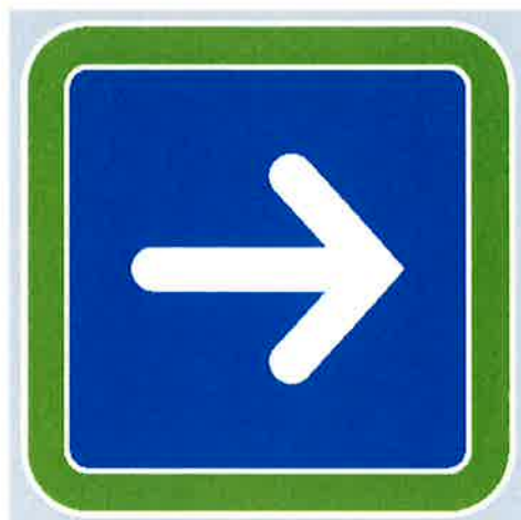
Znak št. 6: "Obvezna smer" (34. člen)