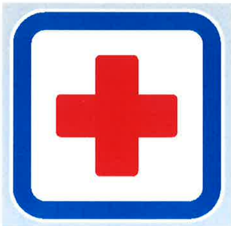
Znak št. 15: "Prostor za prvo pomoč" (36. člen)