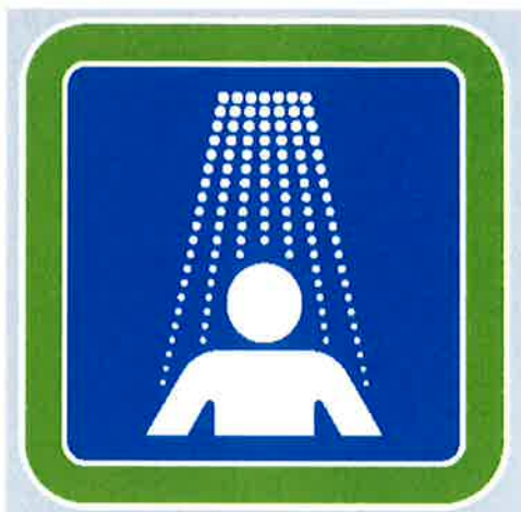
Znak št. 5: Obvezno prhanje" (34. člen)