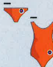
Majica in ženska kopalka