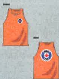
Majica brez rokavov