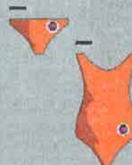
Majica in hlačna kopalka