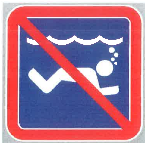
Znak št. 12: "Prepoved plavanja pod vodo" (35. člen)