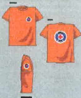
Majica s kratkimi rokavi