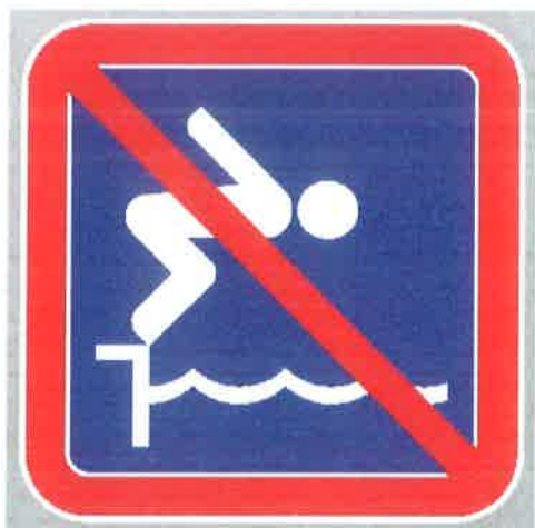
Znak št. 11: "Prepoved skakanja v vodo" (35. člen)