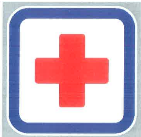
Znak št. 15: "Prostor za prvo pomoč" (36. člen)