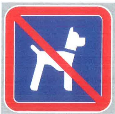
Znak št. 9: "Prepoved vstopa živalim" (35. člen)