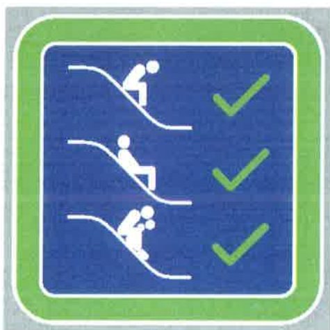
Znak št. 7: "Dovoljeni položaji pri spuščanju po toboganu" (34. člen)