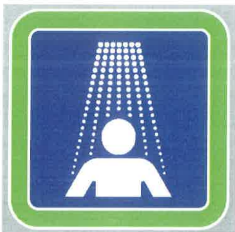
Znak št. 5: Obvezno prhanje" (34. člen)