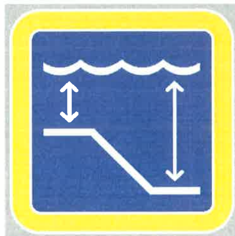
Znak št. 14: "Sprememba globine vode" (36. člen)