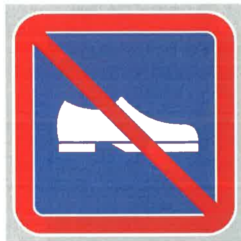
Znak št. 8: "Prepoved hoje v obuvalu" (35. člen)