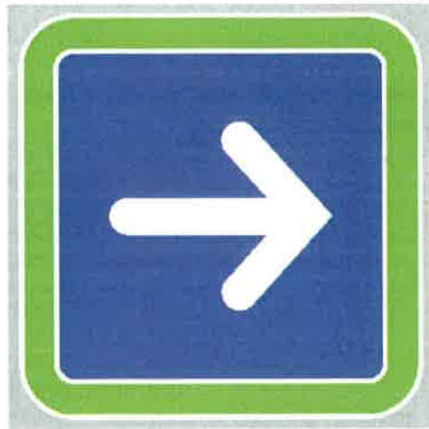
Znak št. 6: "Obvezna smer" (34. člen)