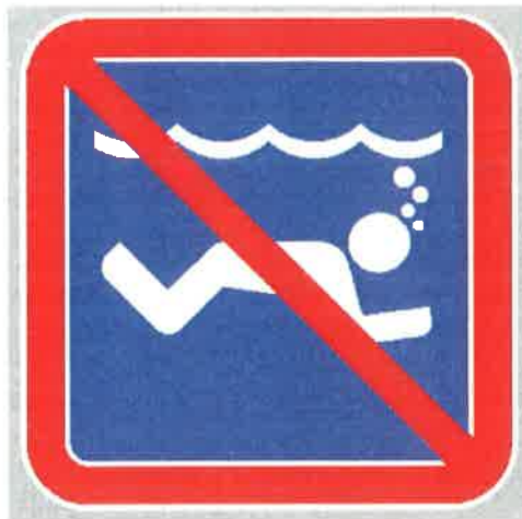
Znak št. 12: "Prepoved plavanja pod vodo" (35. člen)