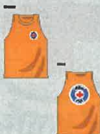
Majica brez rokav