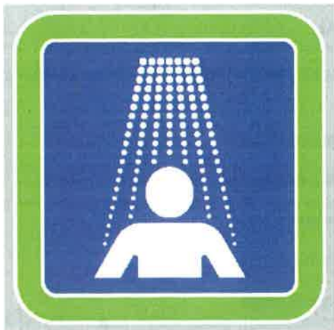
Znak št. 5: Obvezno prhanje" (34. člen)