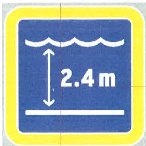
Znak št. 13: "Globina vode" (36. člen)