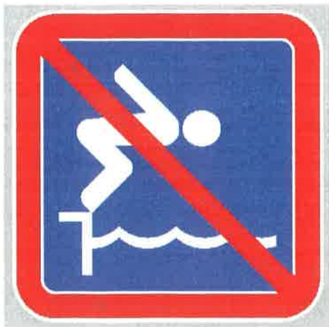
Znak št. 11: "Prepoved skakanja v vodo" (35. člen)