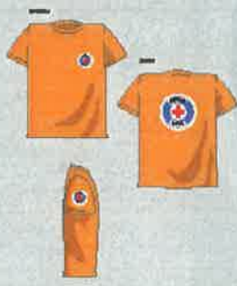
Majica s kratkimi rokavi