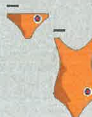
Malice in ženske kopalne