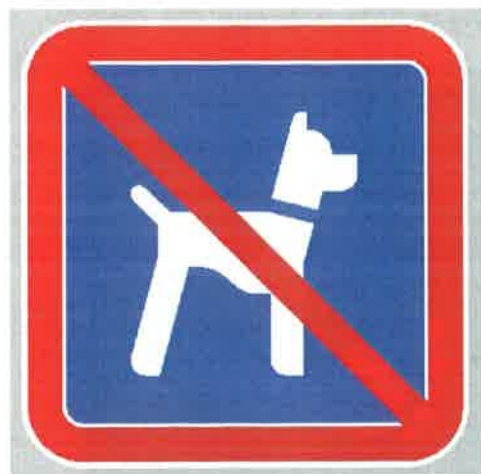
Znak št. 9: "Prepoved vstopa živalim" (35. člen)