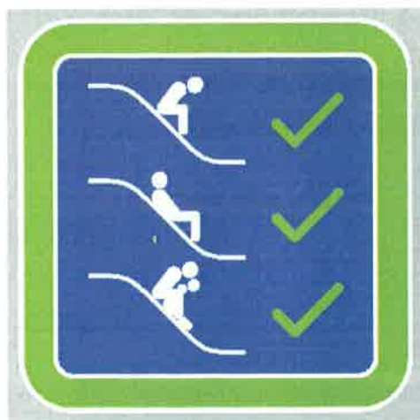
Znak št. 7: "Dovoljeni položaji pri spuščanju po toboganu" (34. člen)