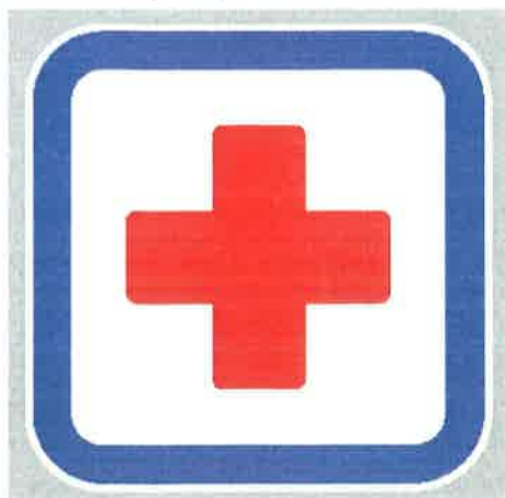
Znak št. 15: "Prostor za prvo pomoč" (36. člen)